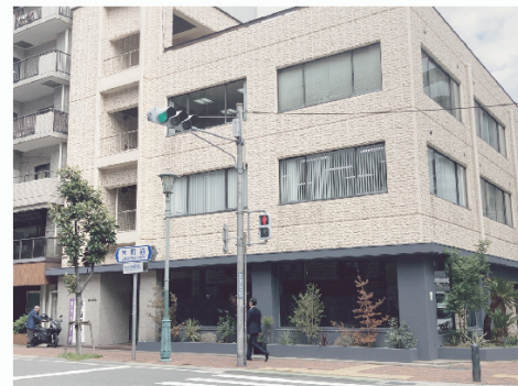
1階 J' Ai la Peche (ジェラペシュ) 「補聴器」の看板の横が入口です